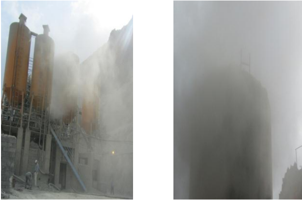
شکل ۱: محیط بچینگ ها به هنگام شارژ سیمان و تولید بتن قبل از اجرای روش کنترل

می‌شد. به همین دلیل برای کاهش فشار وارده دو سیلوی سیمان با لوله‌های ۸ اینچ به هم متصل گردیدند. لازم به ذکر است بیشتر فشار وارده به سیلوهای سیمان توسط لوله ۴ اینچ خروجی گرد و غبار گرفته می‌شود (شکل ۲).