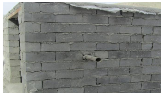
شکل ۵: اتاقک رسوب دهنده و محل ورود گرد و غبار

شکل ۴: لوله های ۴ اینچی ورود سیمان و خروج گرد و غبار به اتاقک رسوب دهنده