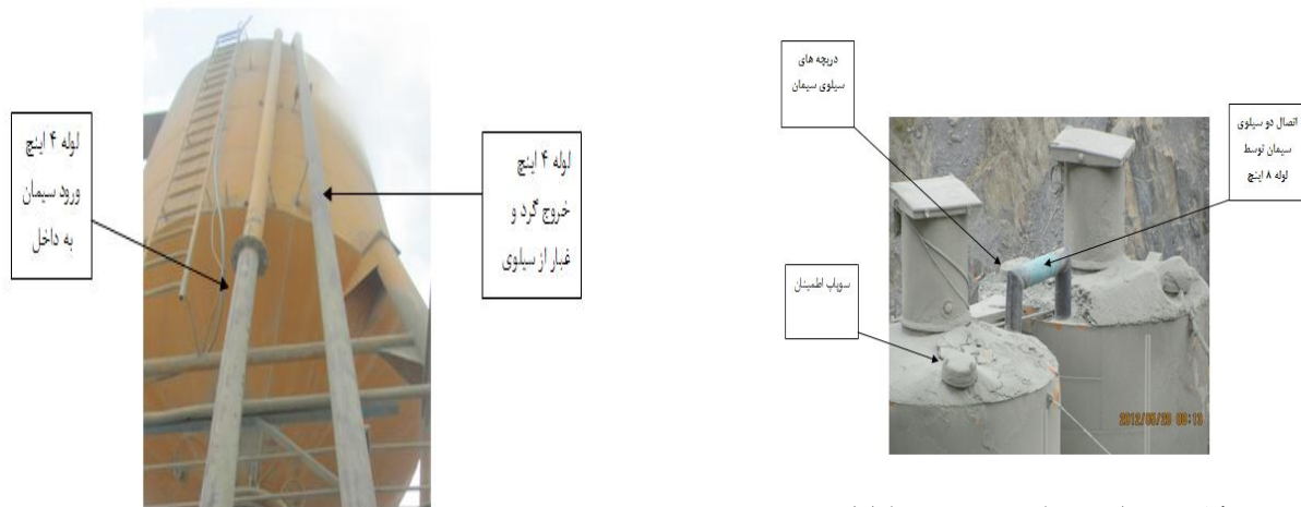
شکل ۳: اتصال دو سیلوی سیمان توسط لوله ۸ اینچ

شکل ۴: لوله های ۴ اینچی ورود سیمان و خروج گرد و غبار به اتاقک رسوب دهنده