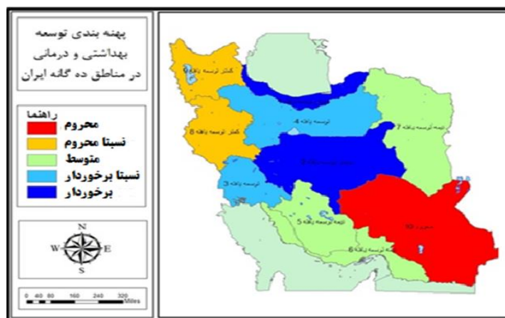
شکل ۲: پهنه‌بندی کلان مناطق کشور با مدل تاپسیس