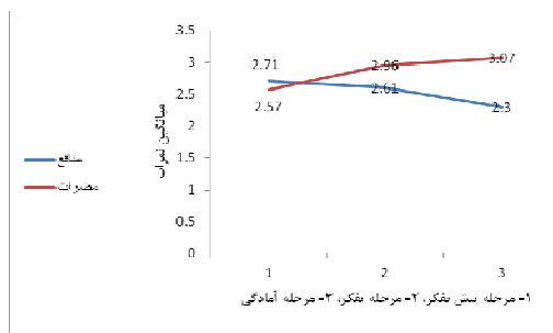
نمودار ۲: میانگین نمرات منافع و مضرات مصرف سیگار در مراحل سه گانه

ولی با حرکت از مرحله پیش تفکر به مرحله آمادگی منافع درک شده ناشی از مصرف سیگار کاهش معنی داری را نشان می‌دهد که این کاهش در افراد واقع در مرحله آمادگی نسبت به دو گروه دیگر به طور معنی داری بیشتر بود (نمودار ۲). همچنین میانگین نمرات موانع درک شده ناشی از مصرف سیگار در افراد واقع در مرحله پیش تفکر نسبت به افراد واقع در دو مرحله تفکر و آمادگی کمتر بود (نمودار ۲).